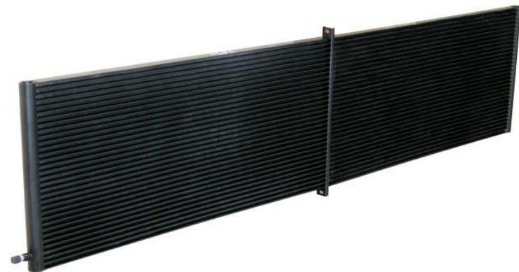
PARALLEL FLOW CONDENSERS